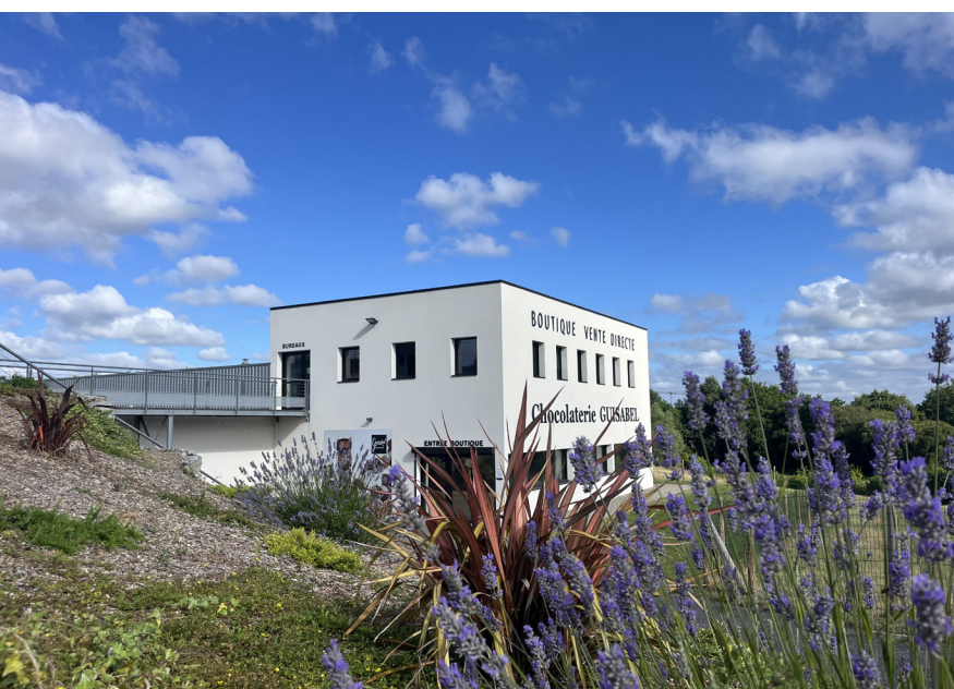
Chocolaterie Guisabel, Candé, Angrie