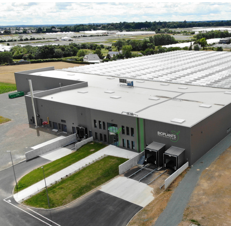
BIOPLANTS, Les Ponts-de-Cé

Le développement économique est aujourd'hui un enjeu phare et complexe pour les territoires en termes d'emploi, d'attractivité, de dynamisme... Aux côtés des collectivités locales, Alter déploie ses outils et son organisation pour leurs apporter des solutions adhoc et efficaces.