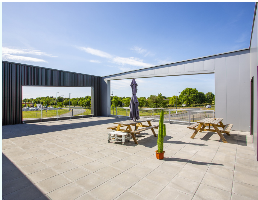
ICI Imprimerie Beupréau-en-Mauges