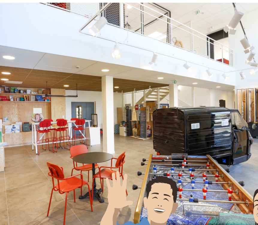
ICI Imprimerie Beaupréau-en-Mauges