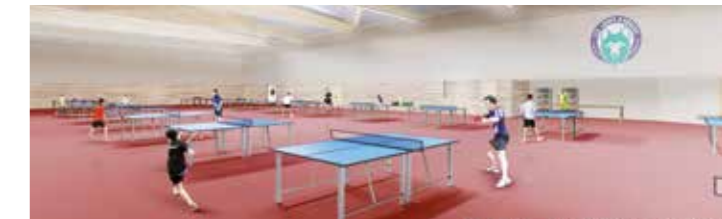
Le tennis de table sera l'une des nouvelles activités proposées.

Avec plus de 2500 m 2 supplémentaires, le gymnase doublera de surface. Sur le plan architectural, confort thermique et acoustique, économies d'énergie, intégration au quartier figurent au cahier des charges.