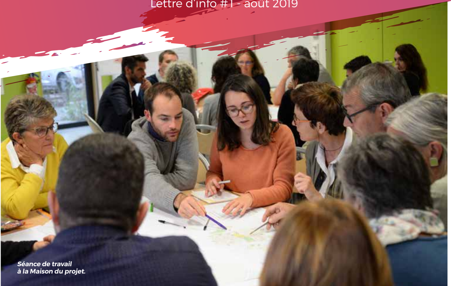
Séance de travail à la Maison du projet.