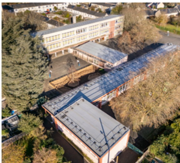
Les travaux devraient avoir lieu durant les années scolaires 2028 et 2029.

Le projet définitif sera présenté au cours du premier semestre 2026, une fois l'architecte choisi et les études techniques réalisées. Quelques concertations spécifiques sont prévues d'ici au démarrage du chantier.