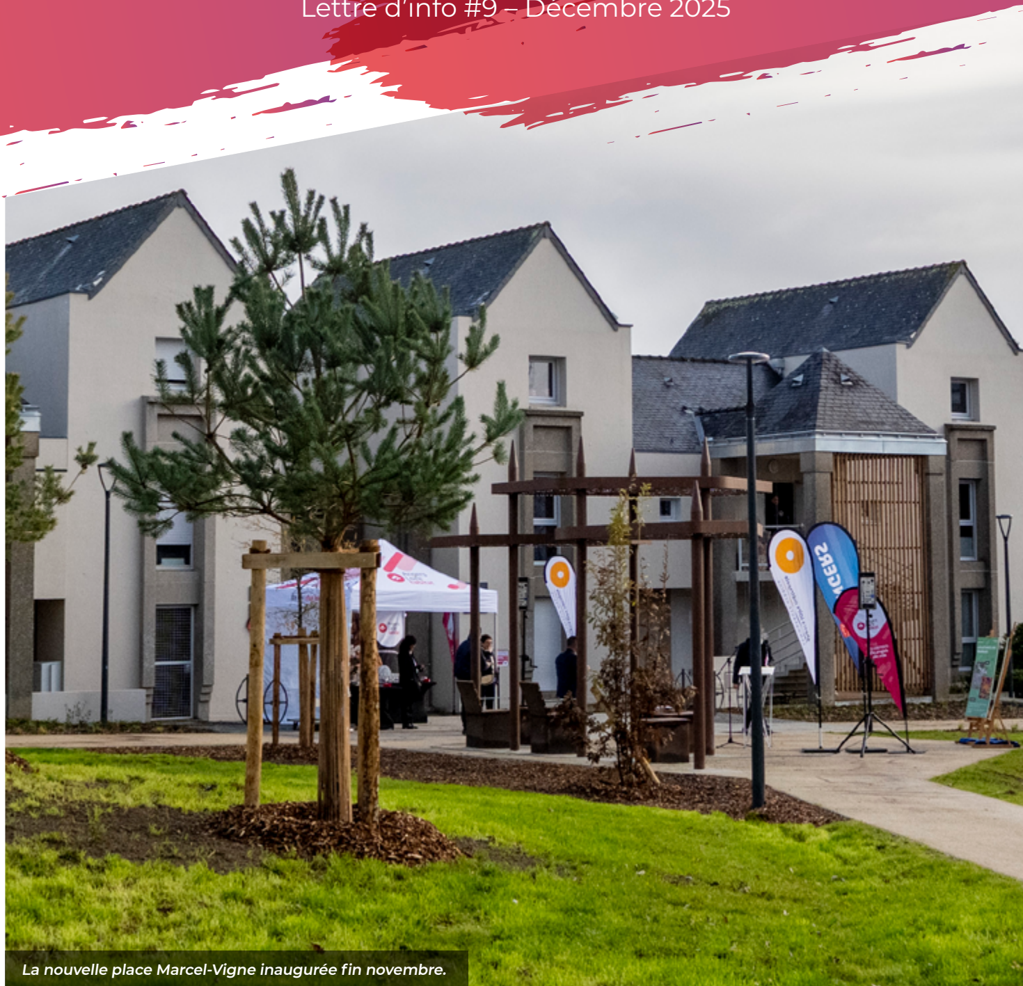
La nouvelle place Marcel-Vigne inaugurée fin novembre.