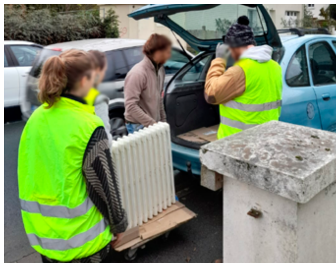
Le réemploi est au cœur de la déconstruction du 42 rue Henri-Hamelin.

La démolition du bâtiment devrait durer de cinq à six mois. S'ensuivra la construction d'une résidence de 45 logements seniors par Angers Loire Habitat à l'horizon 2028.