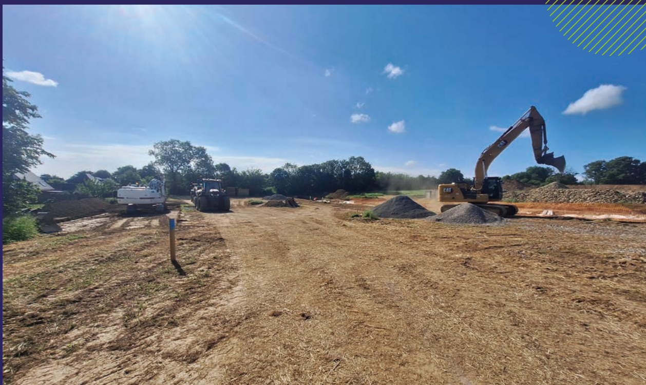
Travaux d'aménagement du nouveau quartier

Dans une volonté affirmée de favoriser les mobilités douces, des liaisons piétonnes et cyclables seront aménagées le long des haies. Ces cheminements offriront des connexions sécurisées vers le cœur de bourg ainsi que vers le sentier de randonnée qui longe le quartier au sud, renforçant ainsi l'accessibilité et la cohérence d'ensemble du tissu urbain.