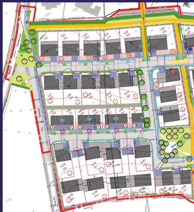
Plan d'aménagement de la première tranche du quartier

Parce projet, la commune de Longuenée-en-Anjou affirme sa volonté d'accompagner la croissance démographique dans un esprit de durabilité, en conciliant urbanisation, paysage et qualité de vie.