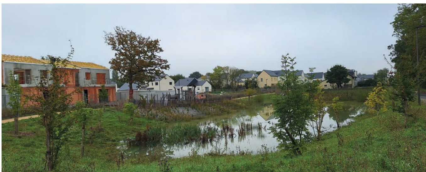
Nouveaux logements en construction

Rendez-vous sur notre site www.longuenee-projets.fr pour découvrir tous les projets qui vont transformer Longuenée-en-Anjou