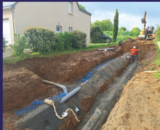
Installation des réseaux de raccordement pour alimenter les futurs logements