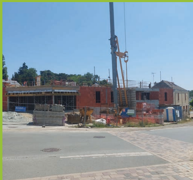
Nouveaux logements d'Angers Loire habitat en cours de construction

Sur l'ancien site de La Poste, une autre résidence d'Angers Loire habitat Les Cerisiers proposera 30 logements, dont 22 adaptés aux seniors, avec des équipements favorisant l'autonomie. Des cheminements piétons seront réalisés afin de faciliter l'accès aux commerces et services du centre-