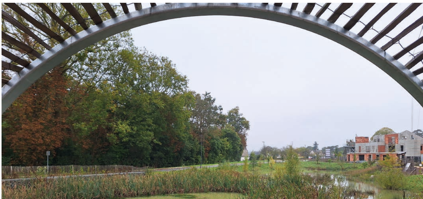
Vue depuis l'observatoire à oiseaux et amphibiens

Pour compléter l'offre de logements, une nouvelle livraison est prévue à la fin de l'année 2025 de deux programmes de logements sociaux. La résidence Le Brisson comptera 16 logements (appartements et maisons individuelles) situés autour du bassin d'orage, tandis que Les Villas Maillanne proposeront 5 logements individuels en locatif social.