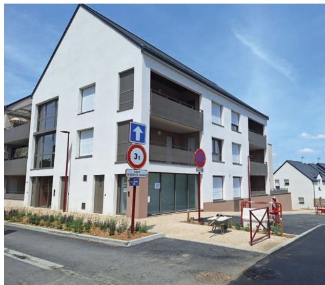
Résidence Le Choiseau

À proximité, Les Villas Juliette regroupent 5 maisons en accession sociale à la propriété, dont une est encore disponible à la vente.