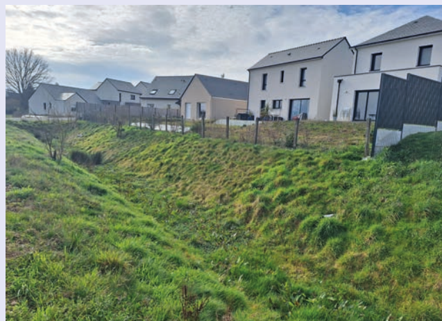
Développement du quartier résidentiel des Chênes 2

La livraison de l'ensemble est prévue pour le premier semestre 2026. Ce développement résidentiel vient renforcer l'offre de logements diversifiés dans un quartier pensé pour la qualité de vie, à proximité des équipements publics et des circulations douces, dont la passerelle piétonne, récemment aménagés.