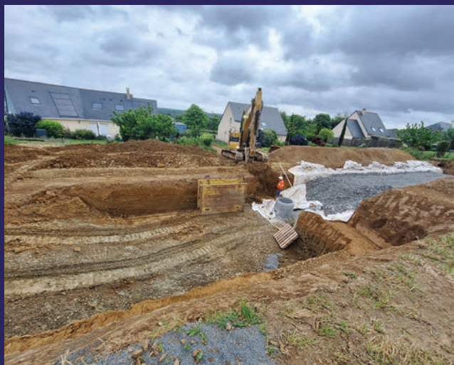
Création des tranchées d'infiltration des eaux pluviales