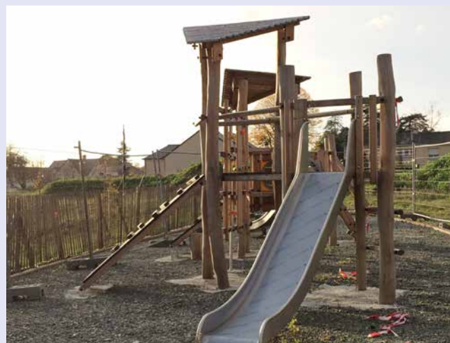
Aire de jeux installée au sud du quartier des Pâtisseries

Aussi, dans l'aménagement du quartier, un petit observatoire en bois a été mis en place au niveau du bassin de rétention afin d'observer la faune et la flore présentes sur le site en permanence.