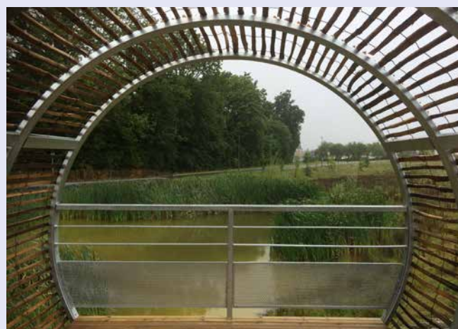
Observatoire à oiseaux et amphibiens