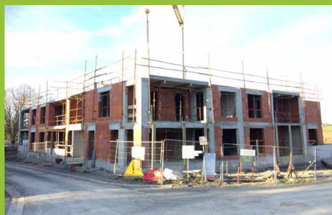
Travaux de construction de la résidence du Choiseau

L'intégralité de ce vaste programme de logements se terminera en 2025.