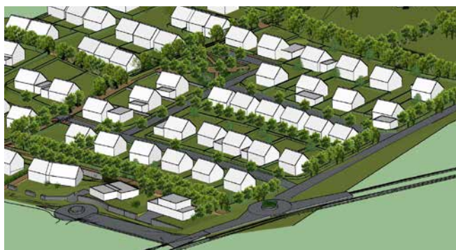
Perspective de la tranche 1 du quartier Beusoleil

Les études opérationnelles se finaliseront dans les prochains mois avec l'objectif de consulter les entreprises de BTP au printemps. Le démarrage des travaux de viabilisation d'une première tranche est envisagé pour le second semestre 2024.