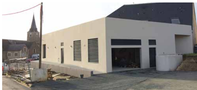
Superette agrandie dans le centre-bourg de La Meignanne

Le bailleur social, Angers Loire Habitat, vient de finaliser son projet qui se situera en face de la place de l'Église. Il s'agira d'un programme immobilier comprenant six appartements. Les travaux démarreront au printemps 2024 pour une durée de 18 mois.