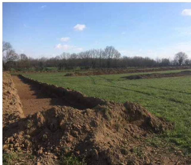
Diagnostic archéologique préventif réalisé en février 2023