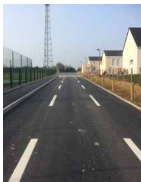
Nouvelle voie avenue du Stade

Dans cette logique, deux parkings ont été créés aux extrémités de l'avenue du Stade pour compenser la perte de stationnement, suite au réaménagement de la rue donnant la priorité aux cyclistes. Un dispositif de Chaussée à Voie Centrale Banalisée (C.V.C.B.) avec deux bandes cyclables de chaque côté de la route a en effet été mis en place.