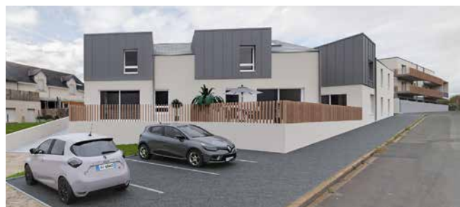
Perspective du futur programme d'Angers Loire Habitat

En cœur d'îlot, un espace partagé végétal sera créé permettant de favoriser un îlot de fraîcheur et une barrière végétale pour le parking. À cet endroit, sera intégré un emplacement pour les bacs à ordures ménagères.