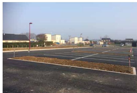
Nouveau parking près des équipements sportifs