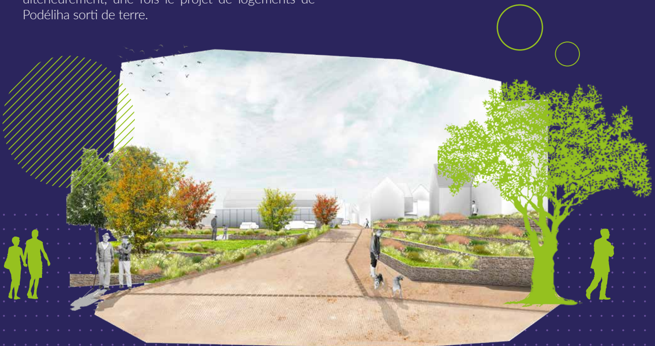
Avant-Projet du centre-bourg du Plessis-Macé. Vue depuis le parc vers la place de la mairie requalifié

Parallèlement, des fouilles archéologiques seront réalisées sur une emprise mineure de la place de la mairie correspondant à l'emprise au sol de l'extension du futur projet de Podéliha.