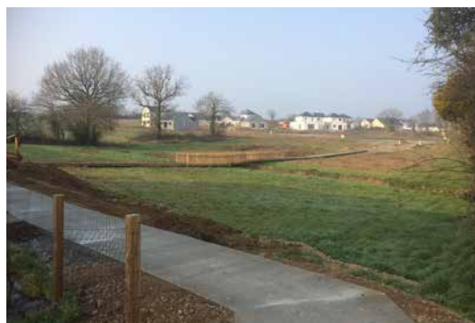
Passerelle au niveau de la coulée verte