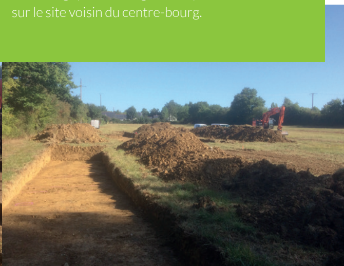
Site des Pâtisseries à La Meignanne Diagnostic archéologique