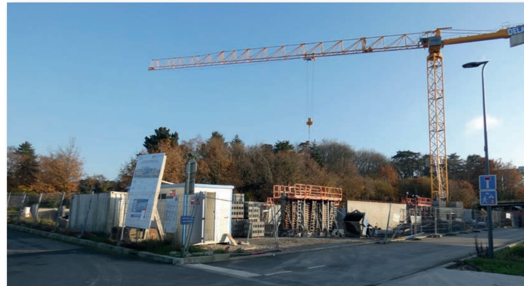
Avancement des travaux au 5 décembre 2019

Les travaux de terrassement ont démarré en mai et la livraison est prévue au 1 er semestre 2021. Le coût estimatif du projet est de 4 M d'€.