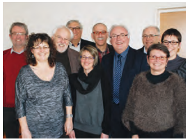
L'ÉQUIPE MUNICIPALE DE BEAUCOUZÉ